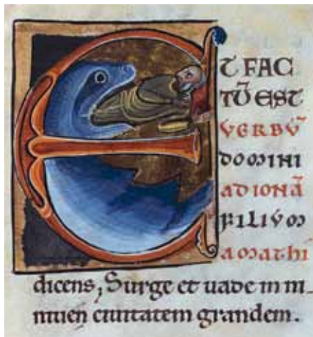
Jona und der Wal - französische Bibeliniale aus dem 12. Jahrhundert.

tes überhaupt nicht angesprochen. Diese seien vielmehr die „Identitätsgrundlage“ einer gerade nichtchristlichen Religionsgemeinschaft, eben des Judentums, von dem sich die Kirche über den Juden Paulus hinaus zunehmend in der Geschichte unterschieden hat. Und wirklich missverständlich wird es in dem umstrittenen Jahrbuchbeitrag, wenn Slenczka von Texten „minderen Rangs“ spricht – gemeint ist: aus der Sicht eines „christlich-religiösen Bewusstseins“. Ob das bereits judenfeindlich ist oder nicht, ist weiterhin des Streitens in der Tat wert. Andeutungen einer Abwertung einer anderen Religion, mögen sie so kompliziert innertheologisch formuliert sein wie diese, könnten auf ein Defizit im grundlegenden Zugang hinweisen, nämlich auf die Frage, wie heute überhaupt ein Dialog der Religion mit ihren jeweiligen Traditionen und mit anderen Religionen zu führen sei. Aber das ist nicht das Thema des Beitrages von Slenczka zur kanonischen Bedeutung des Alten Testaments.