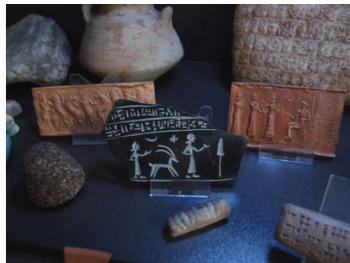
Stempel und Abrollungen aus der archäologischen Lehrsammlung

Zunächst gehört zu der Sammlung die von Hugo Großmann erstellte Kollektion historischer Palästinaabilder. Sie besteht überwiegend aus Glasplattendias (etwa 2000) mit Fotografien aus der Zeit des ausgehenden 19. Jahrhunderts und des frühen 20. Jahrhunderts, die Hugo Großmann 1906 und 1907 bei zwei archäologischen Reisen durch Israel, und zwar durch das Westjordanland und das Ostjordanland, angefertigt hat. Die Bilder zeigen Orte, bedeutende Gebäude sowie die Stadt- und Landbevölkerung in ihrem Lebenszusammenhängen mit Handwerk und Landwirtschaft. Großmann forschte und lehrte von 1907 bis 1927 an der Theologischen Fakultät der damaligen Friedrich-Wilhelms-Universität zu Berlin. Die Fotografien gehen zu einem großen Teil auf archäologische Lehrkurse zurück, die Gustav Dalman (1855-1941) als Leiter des bis heute bestehenden Deutschen Evangelischen Instituts für Altertumswissenschaft des Heiligen Landes (DEI) 1902 eingerichtet hatte. Dalman selbst hat eine sehr umfangreiche Sammlung zur Landeskunde Palästinas angelegt, deren Bestände heute u.a. am Gustaf-Dalman-Institut der Universität Greifswald und im DEI in Jerusalem aufbewahrt werden.