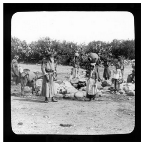
Menschen beim Tragen von Wasserkrügen in Cana (RS325)

Welche Bedeutung haben universitäre Sammlungen Ihrer Meinung nach für Forschung und Lehre und in welchem Umfang wird die Sammlung historischer Palästinabilder dafür genutzt?