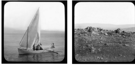
Glasplattendias mit Landschaftsaufnahmen, See Genezareth und Speisung der 5000 Galli, Foto: Hugo Greßmann, Sammlung Historischer Palästinabilder

Es ist nicht nur kulturgeschichtlich interessant, dass die Archäologen schwarze Anzüge trugen oder auch, mit welchen Geräten sie unterwegs waren und was alles zur Ausstattung dazugehörte. Vor allem sieht man auf diesen Bildern einen Ausgrabungsbefund, wie er sich heute nicht mehr darstellt – sei es, weil er durch Erosionen verschüttet ist, sei es, weil über Nachfolgegrabungen einzelne Fundschichten nicht mehr zugänglich sind oder auch weil manche Orte inzwischen überbaut oder ganz zerstört sind.