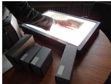
Projektor und Aufbewahrungsboxen für die Glasplattentexte, Foto: Julia Kleinschmidt

Prinzipiell besteht für mich kein Unterschied, ob ich einen Text, ein Artefakt oder eine (historische) Fotografie analysiere, hinsichtlich der Tatsache, dass ich mir in jedem Fall selbst vorher Rechenschaft für meine zu wählende Hermeneutik ablegen muss. Will ich das Objekt oder auch den Text historisch-kritisch, also angesichts seiner Entstehungssituation und -intention betrachten oder rezeptionsästhetisch hinsichtlich seiner gegenwärtigen Wirkung auf mich? Ich kann auch sachorientiert fragen, also mit Blick auf bestimmte Elemente und Inhalte wie bspw. das auf der Fotografie oder im Text vermittelte Menschenbild. Schließlich ist eine textorientierte Betrachtung möglich, etwa wie ein Schriftstück als Text (grammatisch) funktioniert. Für die konkrete Durchführung der Analysen sind natürlich unterschiedliche Kompetenzen nötig. In meinem Arbeitsgebiet heißt das, dass ich für die Textanalysen im engeren Sinn z.B. entsprechende Kenntnisse der altorientalischen Sprachen besitzen und für die Klassifikation der historischen Palästina-bilder über Grundkenntnisse in historischer Fotografie, Landeskunde und Kulturgeschichte Palästinas sowie biblischer Archäologie verfügen muss.