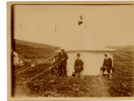
„Ritterzelt“ der Archäologen, Foto: Hugo Greßmann, Sammlung Historischer Palästinaabilder

Teilweise von Greßman selbst fotografiert, teilweise auch gezielt angekauft, wie die Serien der American Colony, zeigen die Fotografien eine interessante Vielfalt der Schwerpunkte, die unterschiedliche Institutionen für ihre Motive gesetzt haben. So ist die Sammlung für die Forschung der verschiedensten Disziplinen, von der Geografie, über Theologie, Archäologie oder Ethnologie bis zur Kunst- und Kulturgeschichte bedeutsam. Außerdem dokumentiert die Sammlung auf einmalige Weise die abenteuerlichen Reisebedingungen im Vorderen Orient zu Beginn des 20. Jahrhunderts.