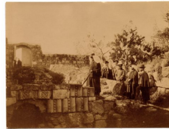
Archäologen in schwarzer Arbeitskleidungm Lazarusgrab (RS234)

Kulturgeschichtlich auch beachtenswert, vor allem aus ethnologischer Perspektive, ist die Darstellung von Menschen auf diesen Bildern. Wir haben in der Publikation zu den historischen Palästinabildern einen Aufsatz, der sich gezielt aus ethnologischer und kulturwissenschaftlicher Perspektive der Fragen widmet, mit welchem Menschenbild man Personen in Kostüme gekleidet und fotografiert hat und welches Bild des Orients diese Fotografien vermitteln (Stichwort: Orientalismus und Eurozentrismus).