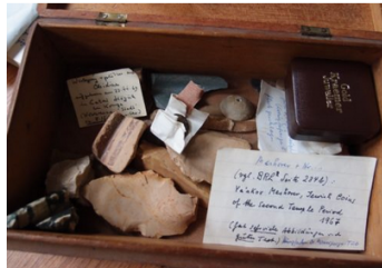
Aufbewahrung von Münzen, Keramikresten, Gewichts- und Feuersteinen sowie Pfeilspritzen mit handschriftlichen Notizen aus der archäologischen Lehrsammlung, Foto: Julia Kleinschmidt

Ebenfalls spannend ist, auf welcher kuriose Weise die Bilder in die Hände der Fakultät gelangten. Greßmann starb 1927 in Chicago auf einer Vortragsreise durch die USA. Da der Transport des Sargs zurück nach Deutschland überaus kostspielig war, verkaufte seine Witwe die Sammlung an das Alttestamentliche Seminar der Theologischen Fakultät Berlin.